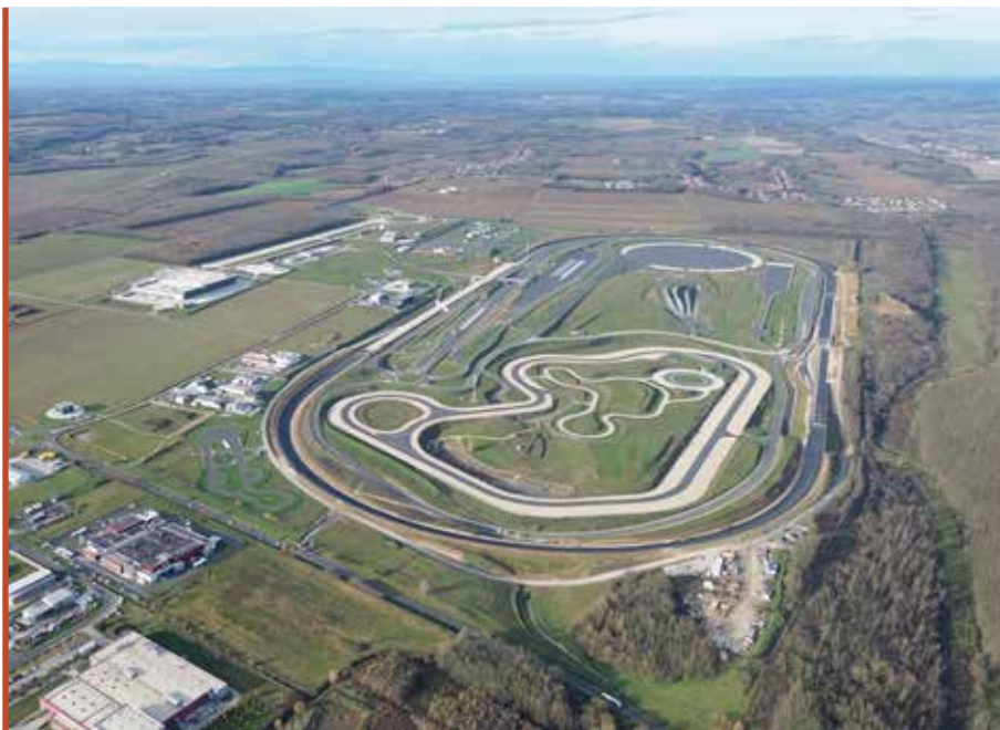
A ZalaZONE Park folyamatosan fejlődik a Járműipari tesztpálya környezetében

– A ZalaZONE Parkban az ipari tevékenységek – legyen szó fejlesztésről, tesztelésről, high-tech gyártásról vagy mérnöki tevékenységről – mellett tudatosan és módszeresen zajlik a kapcsolódó kutatás-fejlesztési képességek építése, humán oldalról és egyetemi együtt-