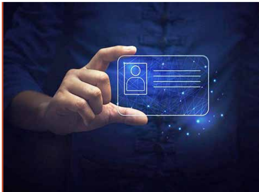
A Digitális Állampolgárság Program megvalósítását a vármegyei kormányhivatal is segíti

– Fontos változás, hogy 2024. január 1-től a Közigazgatási és Területfejlesztési Minisztérium felelősségi körébe tartozik a vármegyei kormányhivatalok működtetésének koordinációja. Október 1-től bővült a kormányhivatalok hatósági jogköre a katasztrófavédelmi területi szervekhez tartozó tűzvédelmi, iparbiztonsági, vízvédelmi és vízügyi hatósági feladatok átvételével, melynek eredményeként egy új főosztály, a Tűzvédelmi és Iparbiztonsági Hatósági Főosztály kezdte meg működését két osztállyal. Az így létrejött új főosztály működése egyszerűsítést is jelent, hiszen ezáltal egy szervezetben belül történik meg egy adott szakkérdés vizsgálata, és a döntéshozatal is. A feladatok és hatáskörök átvétele jelentős szer-