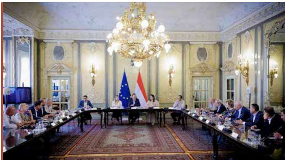
A szakminisztériumban folyamatok az egyeztetések a Versenyképes Járások Programról

A vármegyei önkormányzat konzorciumvezetésével zajló foglalkoztatási pályázat megvalósítása ütemezetten halad, a célcsoportba tartozó személyek bevonását és a nyújtható támogatások folyósítását tavaly kezdte meg a Zala Vármegyei Kormányhivatal. Rövidesen elmondhatjuk, hogy valamennyi kerékpárút-fejlesztési projektünk a kivitelezés szakaszába lép, s idén várhatóan birtokba vehetik a biciklisek a Sármellék–Zalavár, a Garabonc–Nagyrada–Zalasabar–Esztergályhorvati, valamint a Teskánd–Zalaegerszeg szakaszt is. Ezekkel a beruházásokkal további jelentős előrelépés történik a hálózatosság kialakításában. ■