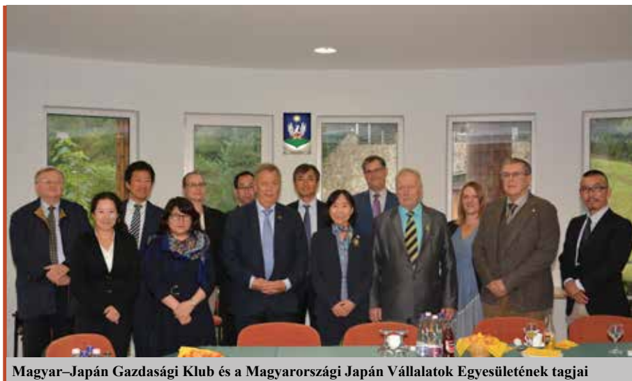
Magyar–Japán Gazdasági Klub és a Magyarországi Japán Vállalatok Egyesületének tagjai

Mindezek megvalósításához szükség van a megújuló Energiaforrásokot (RES) és az Energia Racionális Felhasználást (RUE) célzó állami és magánbefektetések bekapcsolására is. A RURENER-hálózat ehhez eszközöket és módszereket kínál a tagjai számára az energiastratégiájuk kidolgozásához és megvalósításához. Az energiasemlegesség elérése érdekében konferenciákat, tudástranzfer meetingeket szerveznek, tanácsadást nyújtanak a belépni szándékozó tagoknak, felkutatják az Európa-