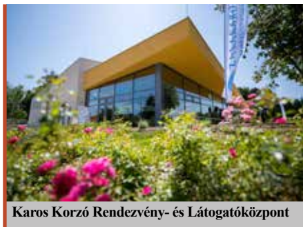
Karos Korzó Rendezvény- és Látogatóközpont

– A településünk rendkívül színes, sokféle vállalkozás, civil szervezet él és dolgozik itt. A munka elkezdődött, erről a médiában és a polgármester közösségi oldalán is tájékoztatást kapnak a zalakárosiak. Fontosnak tartom a lakosság teljes körű tájékoztatását az aktuális te-