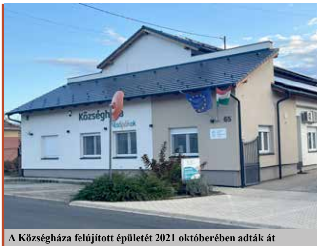
A Község Hivatala felújított épületét 2021 októberében adták át

A Balaton, Hévíz és Keszthely közelsége turisztikai vonzerőt jelent a több mint 776 éves múltra visszatekintő településünk számára. Hírünket viszi a Kolping Hotel, az ország első családbarát szállodája. A hozzánk látogatók egy modern, ám hagyományait, természeti értékeit őrző faluban pihenhetik ki magukat, és lehetnek részesei programjainknak. ■