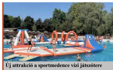
Új attrakció a sportmedence vízi játszótéren

Nagykanizsán született 1978-ban. A Pannon Egyetem közgazdász-turizmus-vendéglátás szakán végzett 2009-ben, majd a Szent István Egyetemen szerzett fürdővezető szakmérnöki diplomát. 1998-ban Zalakaroson kezdett el dolgozni különböző területeken, majd Bükön és Lentiben. 2022. június 1-jétől a Zalakarosi Fürdő Zrt. vezérigazgatója. Nős, két fiúgyermek édesapja.