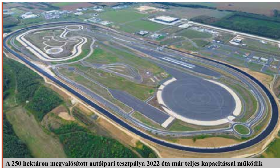
A 250 hektáron megvalósított autóiari tesztpálya 2022 óta már teljes kapacitással működik

A vállalati fejlesztések mellett ott vannak az egyetemünk. Most már nincs olyan egyetem, amelyik, ha kicsit is, de ne foglalkozna a mesterséges intelligenciával, ne végezne járműipari kutatásokat. Azzal is tisztában vagyunk, hogy egy ilyen pálya soha nincs kész. Ez nemcsak a zalaegerszegire igaz, hanem azokra is, amelyek már 70-80 éve működnek. Ezeket mindig újabb és újabb elemekkel kell kiegészíteni. Mi most megelőztük a világot, de nem mondhatunk le a partnereink igényei szerinti, folyamatos fejlesztésekről. ■