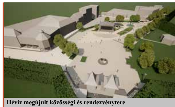
Hévíz megújult közösségi és rendezvénytere

– Valóban, az audit és nemzetközi számviteli szakmát cseréltem fel a polgármesterséggel. Ha valaki audit igazgatóként dolgozik, akkor azon csak nyomós indokkal változtat. Miért indultam el a választáson? Azért, mert nagyon szeretem