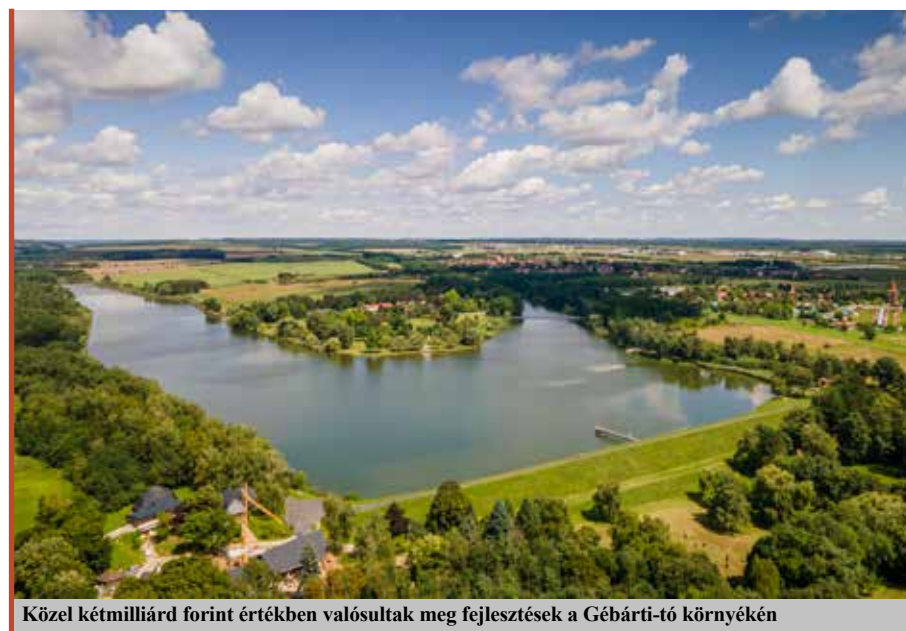
Közel kétmilliárd forint értékben valósultak meg fejlesztések a Gébárti-tó környékén

Emellett pedig a Zalaegerszegi Szakképzési Centrum első helyen áll a magyarországi centrumok közül a versenyeredményeket illetően a szakmák világbajnoki és Európa-bajnoki megmérettetéseiben. Városunk megérett arra, hogy a zalai központi funkciók ellátásán túl már térségi, regionális meghatározó szerepkört is magára vállaljon. Mostanra újra büszkeség lett zalaegerszeginek lenni! ■