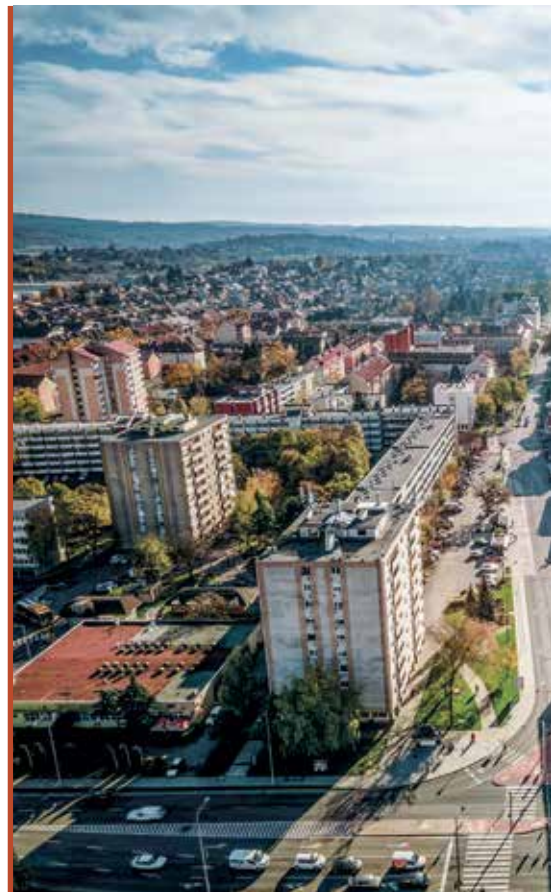
A megújult és kétirányúvá váló Kosztolányi utca