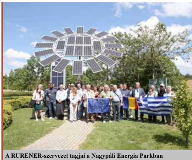
A RURENER-szervezet tagjai a Nagypáli Energia Parkban