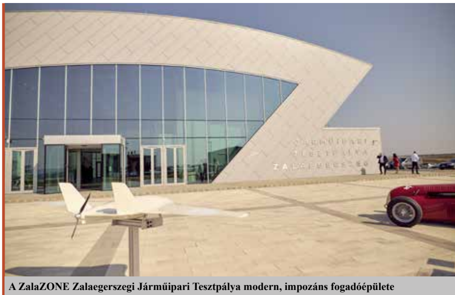
A ZalaZONE Zalaegerszegi Járműipari Tesztpálya modern, impozáns fogadóépülete

– Sok mindenre alkalmas. Megvannak a klasszikus tesztpálya-funkciói, amikor az autóval biztonságos körülmények között lehet nagy sebességgel, bonyolult körülmények között manővereket végrehajtani. Hamarosan