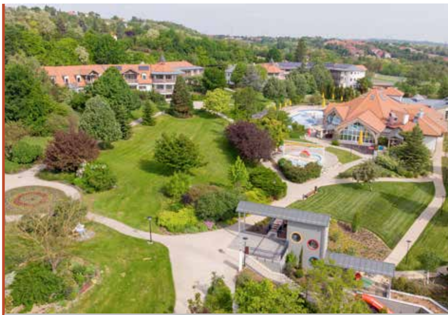
A családbarát Kolping Hotel Spa & Family Resort egy időben 450 vendéget tud fogadni

Ugyanis szembe kell néznünk az energiaárak emelkedésével, az önkormányzati gazdálkodást érintő finanszírozás változásaival. Egy folyama-