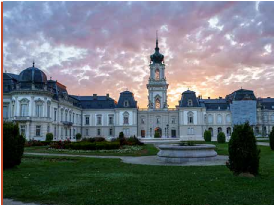
A kastély az évszázadok során jobbra épségben megőrizte belső tereit, berendezési tárgyait

– Az idei évben is számos programmal várjuk a látogatókat. A Kastély-krimi interaktív nyomozós játék az egyik legnépszerűbb vizsdatérő programunk, amelyet a Nádasdy-kastélyban indítottunk el még 2023-ban. Ott akora sikere volt, hogy 2024-ben kipróbáltuk Keszthelyen is, és nem csalódtunk. A résztvevőknek egy rejtélyes bűntényt kell felderíteniük. A tavaszi időszakban folytatódnak ismeretterjesztő és hagyományörző programjaink, hiszen kiemelten fontosnak tartjuk, hogy a gyermekek játékos formában tanulhassanak, művelődhessenek. Március 29-én a keszthelyi kastély történelmi játszótérjében erdei mesék-