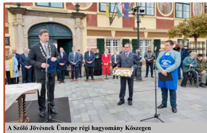
A Szőlő Jövésnek Ünnepe régi hagyomány Kőszegen

Címzetes egyetemi docens, tanár, okleveles borbíró, turisztikai szakértő. 1994 és 2006 között Egyházashelye község polgármestere. 1998-tól a megyei közgyűlés tagja, 2006-tól 2012-ig a megyei közgyűlés alelnöke, 2014 októberétől a Vas Vármegyei Közgyűlés elnöke. A Régiók Európai Bizottságának tagja. Jó néhány könyv szerzője, illetve társszerzője. A Magyar Kultúra Lovagja.