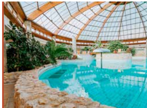
Az élménytér trópusi hangulatot áraszt

– Nagyon sokat dolgoztunk a hatékonyabb működés érdekében. A változtatások a teljes vertikumot érintették: költségeket optimalizáltunk, plusz bevételi forrásokat kerestünk és az adminisztrációs környezetet is rendbe tettük. Az üzleti tervünket teljesítettük, az előző évhez képest növekedett a bevételünk. Ugyanakkor szembe kellett néznünk az energiaváltság és az egyéb külső gazdasági tényezők okozta kihívásokkal. Az energiahordozók extrém árai nagyon nehéz helyzetbe hoztak bennünket. Mindez most annyiban változott, hogy közbeszerzéssel sikerült 10 százalékkal csökkentenünk a gázarat. Örömmel az örömben, hogy az áram költsége viszont megduplázódott. Ebben a helyzetben a 100 százalékos tulajdonos önkormányzat a fürdő mellé állt, és finanszírozta az energiaköltségek egy részét. A városvezetés ugyanis fontosnak tartja a fürdő és rajta kereszt-