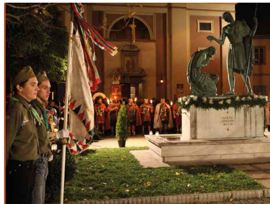
Cserkészek tisztelegnek Szombathelyen Szent Márton szobra előtt, aki csapatuk névadója

Az óvodák és bölcsődék fejlesztésére 2,2