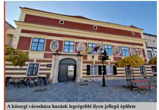
A kőszegi városháza hazánk legrégebbi ilyen jellegű épülete

– A nagy hagyományú és sok vendéget vonzó rendezvények, mint a Szőlő Jövésnek Könyve eseménysorozata, a Kőszegi Várszínház, a Kőszegi Ostromnapok, a Kőszegi Szüret és