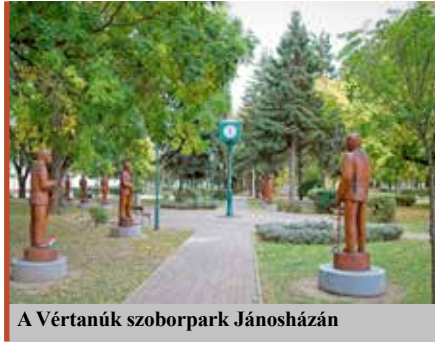
A Vértanúk szoborpark Jánosházán

Az öt évvel ezelőtt összeállított programunkban szerepelt egy idősök otthona kialakítása is, de miután az uniós irányelvek az otthonápolást helyezik előtérbe, ezt nem tudtuk megvalósítani. Az épület rendelkezésre áll, a tervek is megvannak, a megvalósításhoz most