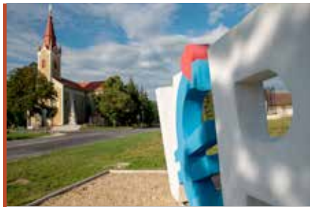
A városlogó mögött a katolikus templom

– A cím elnyerésével jelentős fejlődés indult el településünkön. Pályázati támogatással újultak meg épületeink, és azok energetikai kor-