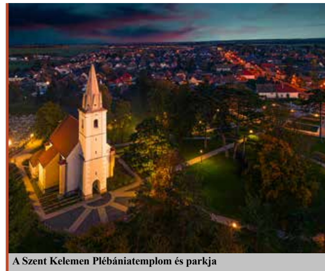
A Szent Kelemen Plébániatemplom és parkja

Ennek tapasztalatai alapján átalakítjuk a rendezvénystruktúrát. A művelődési központ és a fürdő egy összefésült programtárat hozott létre annak érdekében, hogy időben és térben is komplementer legyen a struktúra. A cél az, hogy időben is széthúzzuk a rendezvénye-