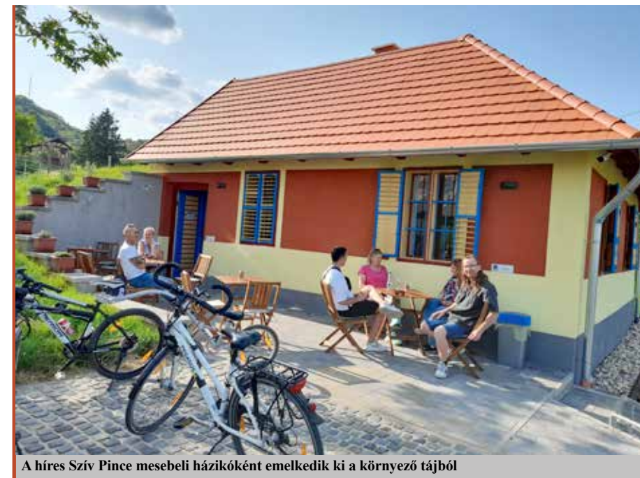
A híres Szív Pince mesebeli házikóként emelkedik ki a környező tájból

1979-ben kaptuk meg a városi rangot, januárban ünnepeltük ennek jubileumát. A celldömölkiek szerint a városban nemigen él olyan család, amelynek tagjai között nem volt, nincs