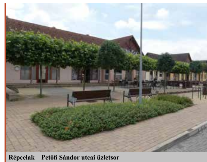
Répcelak – Petőfi Sándor utcai üzletsor

Rengeteg fát ültetünk, parkokat alakítottunk ki. Tisztaság van a városban, de ezért is meg kellett dolgozni. Ha szükségesnek láttuk, akkor naponta kétszer küldtük ki az embereket szemétszedésre. A tapasztalat az, hogy ahol nincs szemét az utcán, ott nehéz bármit is „eldobni”. Ahol viszont van, ott könnyebben szemelnek az emberek. Felújítottuk a ravatalo-