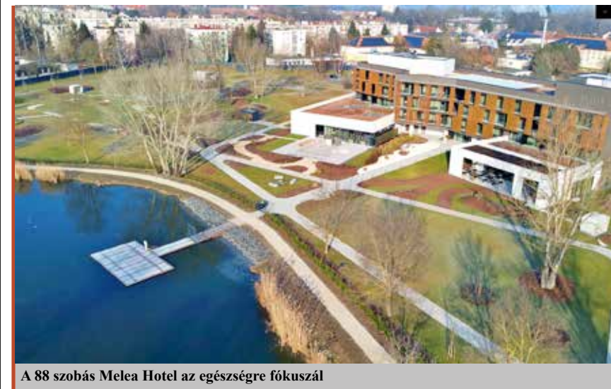
A 88 szobás Melea Hotel az egészségre fókuszál

1954-ben született Sárváron. Szombathelyen népművelő-magyar szakos, a Pécsi Tudományegyetemen felnőttképzési menedzser, a Magyar Táncművészeti Főiskolán táncpedagógus diplomát szerzett. 1977-től a Sárvári Művelődési Központ népművelője, 1988-tól 2002-ig az intézmény igazgatója volt. 2002 és 2010 között Sárvár alpolgármestere, 2010 óta a fürdőváros polgármestere.