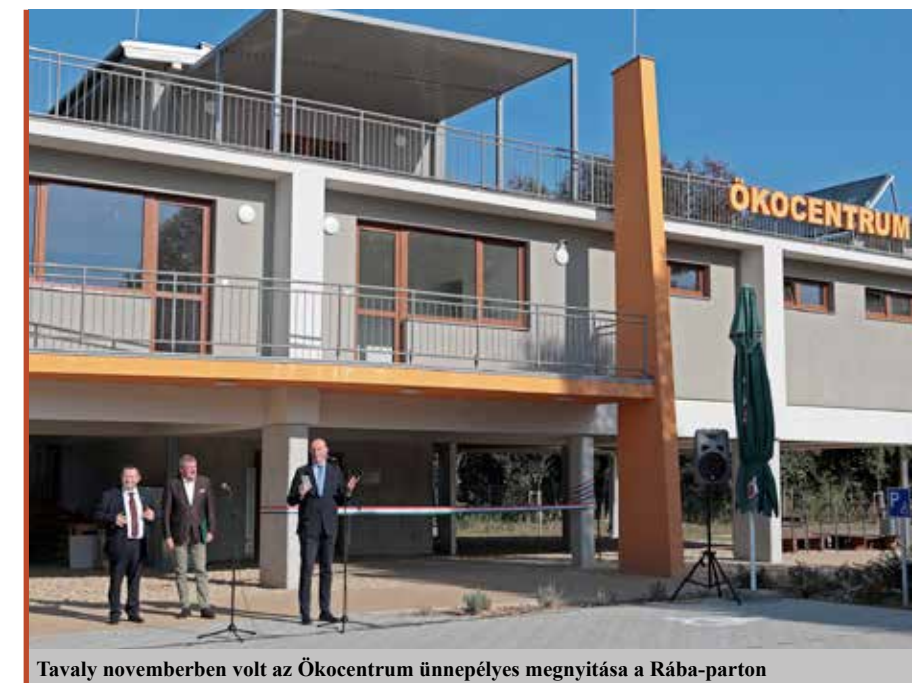
Tavaly novemberben volt az Ökocentrum ünnepélyes megnyitása a Rába-parton

– Az eddig beérkezett jelzésekből az látható, hogy a városban működő cégek folyamatosan igyekeznek helytállni a hazai és nemzetközi piacon. Ebből adódóan rendre teljesítik azokat az adókötelezettségeiket, amelyek a város működőképességének alapját is jelentik. Azt látom, hogy az elkövetkező időszakban