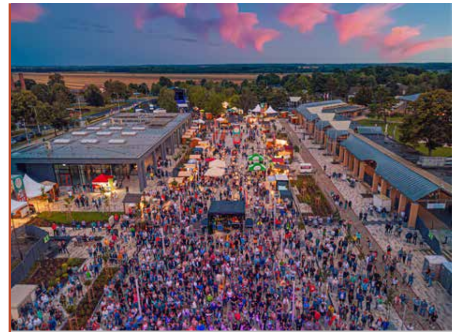
A 3 milliárd forintból megépült Termál tér sok új szolgáltatást kínál az odalátogatóknak

A sajtókáli út mellett, a bő úttól a fürdő túlsó végéig kerékpárutat építünk, ahol lesz közvilágítás is. A munkák már elkezdődtek, s június elejére készül el. Nagy előrelépés, hogy a koronavírus-járvány és az energiaválság után