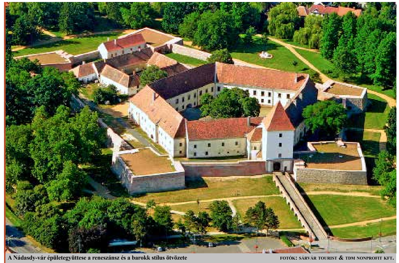
A Nadasdy-vár épületgyűjtése a reneszánsz és a barokk stílus ötvözeté

– A 2023-as esztendő a turizmus területén elég nehezen indult. Több tényezőt figyelembe kellett vennünk a terveink megfogalmazásakor. Az első és legfontosabb az az energiaváltság, amely már az előző év őszén elkezdődött, s rendkívüli kihívás elé állította a turisztikai