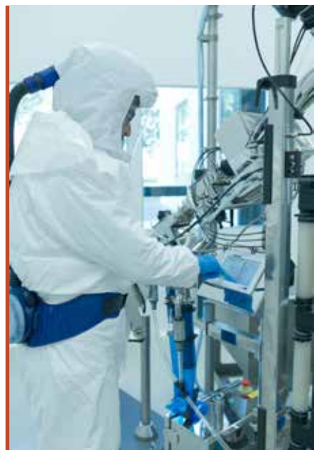
Onkológiai termékek is készülnek Körmenden

1969-ben, 55 éve tették le az Egis Gyógyszergyár Zrt. körmendi üzemének alapkövét. A vállalat akkori egyik kiemelt termékcsoportja, a tejalapú tápszerek gyártására létesítette a gyáregységet, amely – alkalmazkodva a folyamatosan változó körülményekhez – mára számos ismert termék gyártóhelyévé, a magyar gyógyszeripar egyik meghatározó szereplőjének korszerű telephelyévé vált.