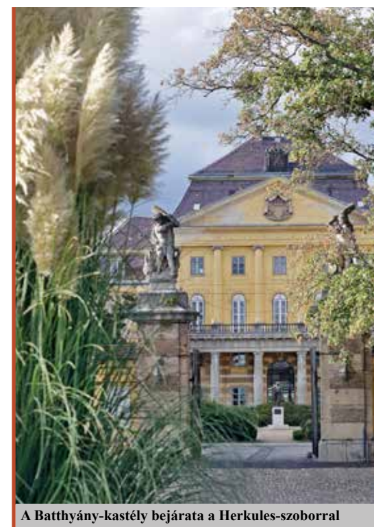
A Batthyány-kastély bejárata a Herkules-szoborral

– Melyek az idejé, illetve a következő időszak kiemelt feladatai?