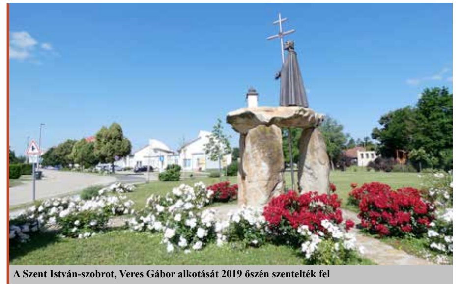
A Szent István-szobrot, Veres Gábor alkotását 2019 őszén szentelték fel

– 2014 óta vagyok Répcelak polgármestere. Ekkor dolgoztuk ki a Répcelak az élhető kisváros programot, amely hosszú távra szóló, tudatos városfejlesztést jelent. Területenként megvizsgáltuk, hogy mit lehet tenni a fejlődés érdekében. Az egészségügyben például kiderült, hogy az 1-es számú háziorvosi rendelőnek az egészségházban jobb helye lenne. Fel-