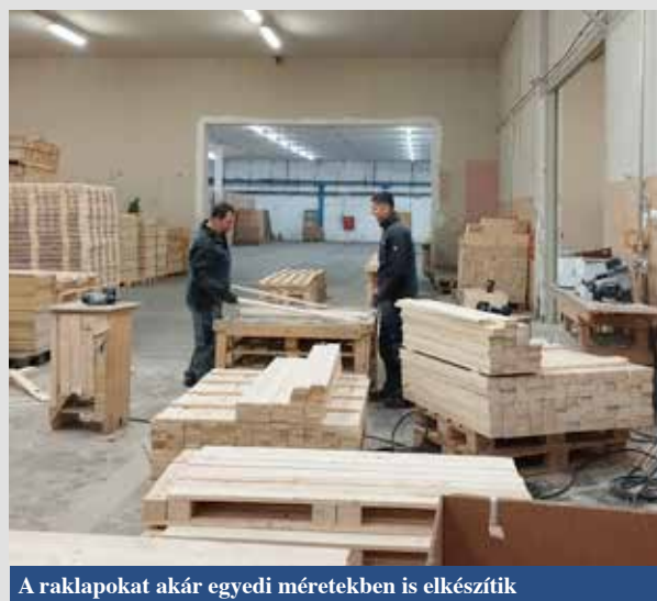
A raklapokat akár egyedi méretekben is elkészítik

Specialitásaink közé tartozik a tengerentúli szállításokra alkalmas csomagolások gyártása.