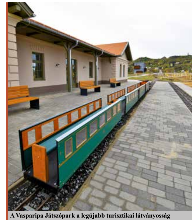
A Vasparipa Játsszópark a legújabb turisztikai látványosság

1958-ban született Celldömölken. 1986-ban a Testnevelési Egyetemen asztaliteniszszakpedagógiai diplomát, 1991-ben a Bessenyei György Tanárképző Főiskolán általános iskolai testnevelő tanári diplomát szerzett. 1994 óta önkormányzati képviselő, 2002-től, immár ötödik ciklusban irányítja Celldömölki polgármesterként. A Vas Vármegyei Közgyűlés tagja.