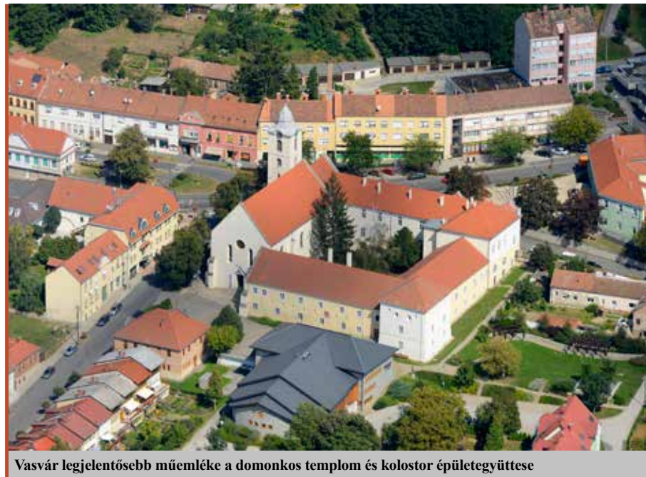
Vasvár legjelentősebb műemléke a domonkos templom és kolostor épületegyüttese

– Az egészségügyben folyamatosak a változások, az állam vesz át feladatokat, ami naprakész egyeztetéseket igényel. Ezen a területen akadnak gondjaink is: a nálunk maradó feladatokra egyre nehezebb lesz orvost találni. Különösen igaz ez az önkormányzati fenntartású szakorvosi rendelőre, ahol nagy szükség lenne az állami intézményekben dolgozó orvosokra is, de az ő foglalkoztatásuk engedélyeztetése nem mindig zökkenőmentes. Persze igyekszünk megoldani az ilyen helyzeteket is. Átalakult az ügyeleti rendszer. Eredetileg úgy volt, hogy Vasvár ügyeleti központ lesz, aztán olyan döntés született, hogy mégsem.