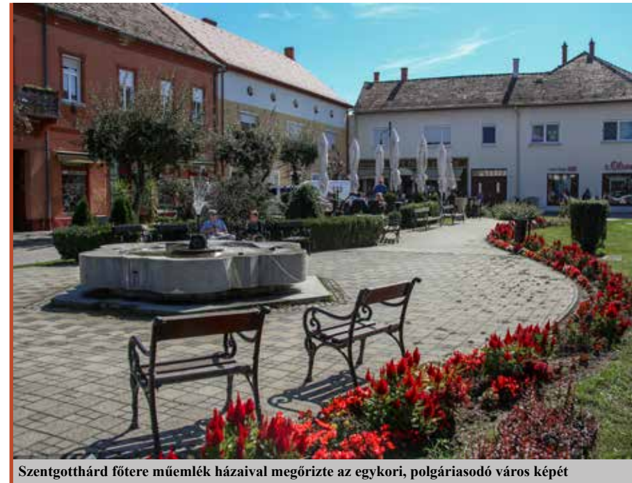
Szentgotthárd főtere műemlék házaival megőrizte az egykori, polgáriassodó város képét

– Az idei költségvetésbe tervezett 1,8 milliárd forint adóbevétel stabil alapokra helyezi a város működését. Az iparüzési adó és az állami normatív támogatások az önkormányzat 4,7 milliárdos költségvetésének mintegy 60 százalékát teszik ki. A fürdő banki kötelezettségének teljesítése nagy fejtörést okoz a városnak. A fürdő Szentgotthárd legnagyobb energiafelhasználója. Az árak elszabadulása miatt a városnak a létesítmény működésének finanszírozásába is be kell szállnia. Nagyon várunk egy részünkről másfél éve beadásra kész energetikai pályázatra, amely önjáróvá tehetné a fürdő működését. Ez egy új kút, valamint egy hőszivattyús rendszer kialakítását tartalmazza. A szálloda – a fürdő miatt –